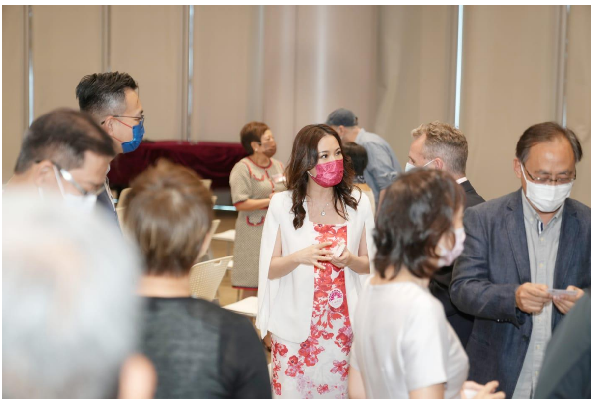
在典禮開始前，眾嘉賓與參會者聚首交流。