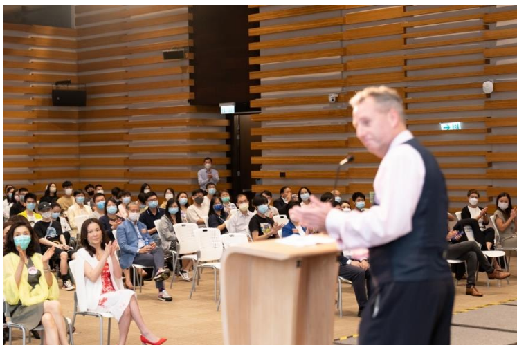
在場觀眾反應熱烈。